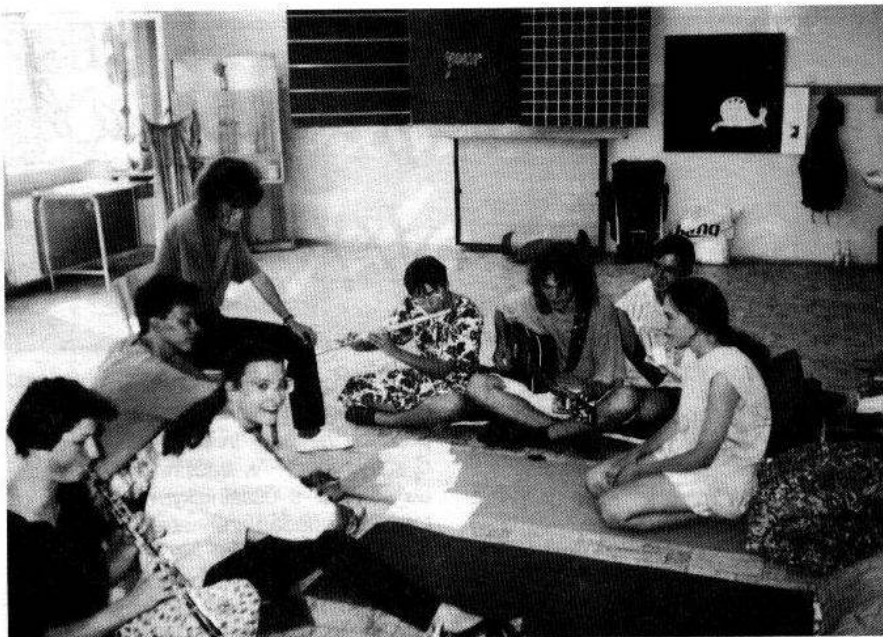
Spoločné muzikovanie počas oddychu