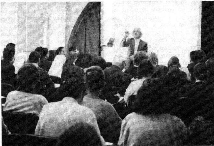
Účastníci gregoriánskeho dňa pri spoločnom speve

V dňoch 17. až 20. decembra minulého roku zaznel cyklus vianočných koncertov po pätnástykrát. S takouto tradíciou sa nemôže pochváliť žiadne mesto v Bratislave. Žiada sa pripomenúť, že sa táto tradícia nerodila ľahko. Štátna