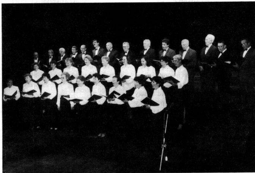
Prešovský katedrálny zbor

postačujúce výhovorky. Žiaľ, ani diri- gentský prejav zbormajstra ma nepre- svedčil, že má interpretované diela nále- žite osvojené. Myslím si, že chrámový zbor katedrály sv. Jána Krstiteľa by mal čo najskôr urobiť všetko pre to, aby bol interpretačne, výrazovo príkladom.