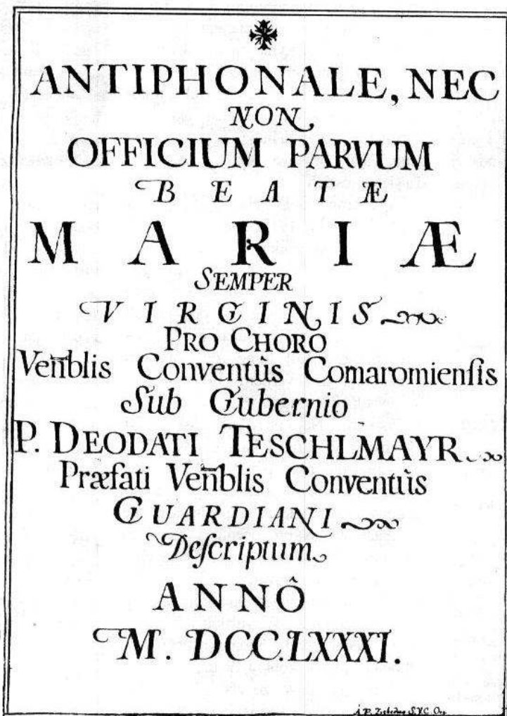
Titulný list odpisu antifonára z 18. storočia, pochádzajúceho z územia Slovenska

A ntifonár (Antiphonale) je bohoslužobná kniha, ktorou sa v ranom stredoveku označoval súbor melódií antifón officia (doplnený rezponzoriálom) alebo zostava antifón omše (doplnené kantatóriom alebo graduálom), prípadne spojenie antifón a rezponzií officia - tak ako je tomu dnes. K rozlíšeniu došlo neskôr označením kníh ako "antiphonarium officii" a "antiphonarium missae". Dnes sa pod týmto označením bohoslužobnej knihy rozumie súbor melódií antifón a rezponzií officia v oficiálnom vydaní (najnovšia verzia antifonára "Antiphonale Monasticum" vyšla v Solesmes v roku 1934). Obsahuje žalmy, žalmové tóny, hymny, malé čítania a verzikuly pre jednotlivé hodiny dňa (laudy, primy, tercie, sexty, nóny, večery, kompletorium).