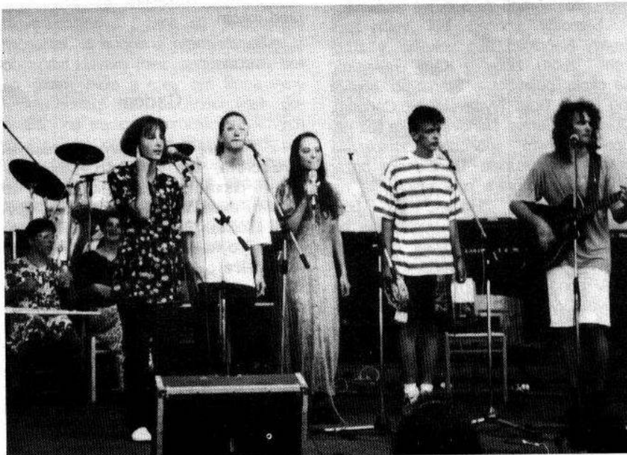
Z festivalového vystúpenia Atlanty