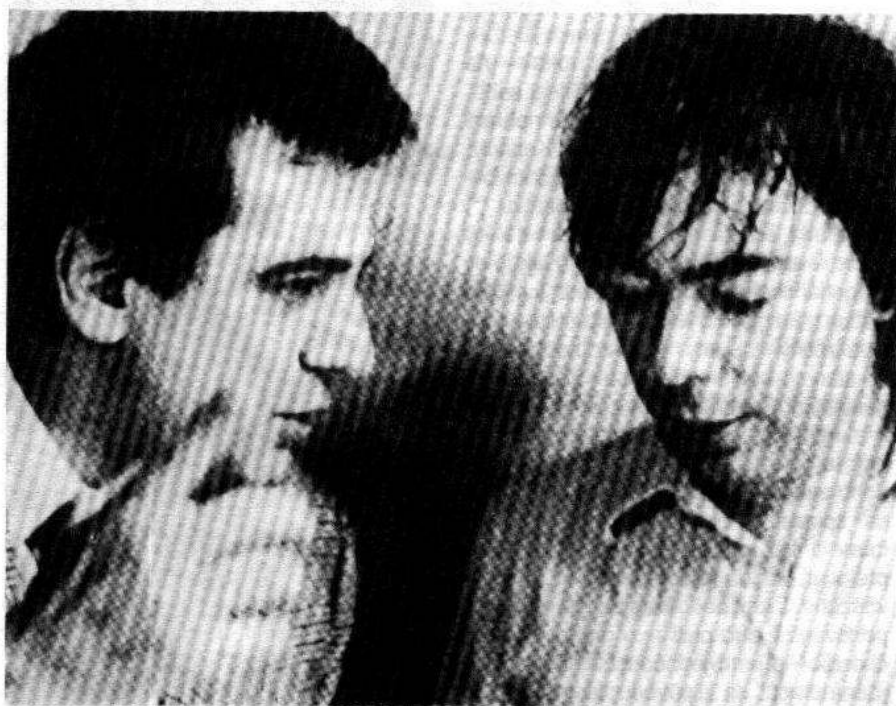
Placido Domingo a Andrew Lloyd Webber pri nahrávaní Requiem